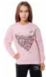
FELPA - grande cuore - art. 0039-A #Pagina: 44, 45, 46

Questa tuta combina stile e praticità. Con un leggero cavallo basso e vestibilità ampia, è perfetta per il riscaldamento, indossata sopra al body. Comoda ma glamour è un capo anche streetwear, abbinabile alla felpa Jacket Maxi Cappuccio, in alternativa al body, con le Tee della collezione. Leggermente arricciata, effetto crestina/ decoro. Sul petto, al fondo e dietro: in vita e alla base dell'ampia scollatura. Fortemente caratterizzata dalle spilline in elastico personalizzato con logo ad intreccio, sul dorso. Morbido micropile nero. Composizione: 100% Poliestere. Taglie: XS, S, M, L. Made in Italy.