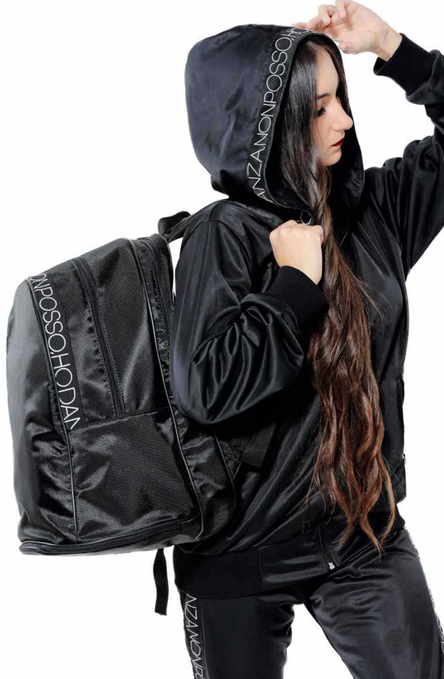
ZIP triacetato art. 0020 size: AS-S-M-L