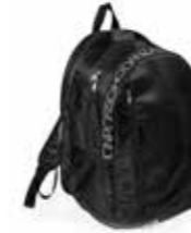
BAGS - bag school big size - art. BGS01 #Pagina: 4, 30, 31, 32, 62, 63

Baggy pants ispirato al modello della scuola Alvin Ailey. Must Have, a grande richiesta ora anche per i più piccoli. Vestibilità ampia e comoda, si adatta ad essere indossato sia per il riscaldamento in sala, sia nell'attività sportiva e nello street wear quotidiano. Modello tubolare, senza cucitura laterale esterna. Con coulisse ed elastico interno in vita, alla caviglia, due tasche interne laterali. Logo hashtag, a banda su tutta la gamba. Transfert bianco. L'alta qualità della felpa rende questo capo particolarmente resistente all'uso nelle sue caratteristiche di forma, consistenza, colore e sgualcibilità. Unisex. Coordinato alla Felpa Zip Logo Composizione: 50% cotone pettinato, 50% poliestere, garzato. Taglia: XXXS 7/8, XXS 9/11.