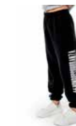
PANTA - alvin hastag girl - art. 0037 #Pagina: 52, 54, 55

La nostra zip must have, a grande richiesta, ora anche per i più piccoli. Vestibilità morbida. Felpa con maniche set-in, tessuto PST (Perfect Sweat Technology), cerniera tono su tono, cappuccio a 3 pannelli foderato in single jersey, tasca a marsupio, polsino e orlo inferiore in costina 1x1, cuciture laterali, felpata internamente. Felpata internamente. Stampa a tutto campo lungo il braccio. Con logo in colore bianco lucido. Coordinata al Pantaloni Alvin Hastag. Unisex Composizione: 80% cotone ring-spun 20% poliestere. Taglie: XXXS 7/8, XXS 9/11