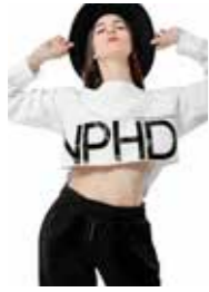
FELPA - maxi crop white - art. 0043 #Pagina: 4, 5, 6

Felpa garzata in materiale ecosostenibile. Il poliestere è ricavato da 6 bottiglie di plastica riciclata. Morbidissima al tatto. Vestibilità oversize. Indosso pratico e funzionale ad ogni tipologia di fisicità. Rifinita con costina nel collo e nelle maniche. Maniche set-in con attaccatura bassa, ampie ed abbondanti. Cuciture laterali per la tenuta della caduta. Nastro interno parasudore. Mezzaluna in jersey sul collo di decoro al retro. Fondo tagliato al vivo, con grande stampa logo NPHD. Transfer nero vernice lucido. Nuova linea di tendenza in perfetto stile StreetChic. Composizione: 80% Cotone pettinato, 20% Poliestere. Taglie: XS, Taglia unica. La taglia unica veste dalla S alla M. La taglia XS veste 12 anni.