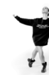
FELPA MAXI - save the art save the world - art. 0042-A #Pagina: 1, 2, 27

Felpe girocollo di alta qualità con maniche set-in, struttura con cuciture laterali, nastro parasudore resistente e di qualità, mezzaluna in single Jersey sulla schiena per un look premium e una maggiore durata nel tempo. Felpe internamente, esterno 100% cotone pettinato. Grande stampa new logo NPHD, in lucido transfer rosa laminato. Nuova linea di tendenza in perfetto stile StreetChic. Coordinabile con il panta Alvin New Logo, il panta accademico lana logo Athleisure e panta accademico lana New Logo piccolo della nuova collezione. Taglie: XS, Taglia unica. La taglia unica veste dalla S alla M. La taglia XS veste 12 anni. Composizione: 80% Cotone pettinato, 20% Poliestere.