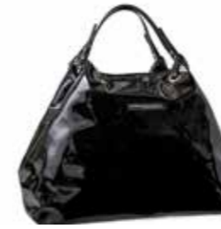
BAGS - shop per dance "scuba waffle" - art. B001 #Pagina: 36, 64

Modello che punta ad ottimizzare la capienza. Ergonomicità e stile grintoso, materiale indistruttibile d'uso sportivo e logo grograin danza. Polifunzionale, per il variegato e creativo mondo dei giovani. In nylon cordura rinforzato. 4 scomparti; 2 grandi tasche laterali, una più piccola frontale, un capiente porta scarpe sul fondo. Manico per il sostegno a mano. Robuste ed imbottite bretelle sagomate per il fissaggio sulle spalle. Fettuccia logo applicata i decoro e griffe. Misure: Altezza 45 cm, Larghezza 33 cm, Profondità 28 cm. Made in Italy.