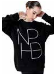
FELPA - maxi logo - art. 0042-B #Pagina: 8, 9

Il tessuto di alta qualità, con mano-felpe ancora più calda e soffice, ottimizzano il confort e la resistenza all'uso del capo. Baggy pants ispirato al modello della scuola Alvin Ailey. Vestibilità ampia e comoda. Adatto perciò, sia per il riscaldamento in sala, sia nell'attività sportiva e nello street wear quotidiano. Unisex. Con coulisse ed elastico in vita, elastico alla caviglia, due tasche interne laterali. New Logo NPHD a transfer nero lucido vernice. Composizione: 80% Cotone, 20% Poliestere. Taglie: XS, S, M, L. Made in Italy.