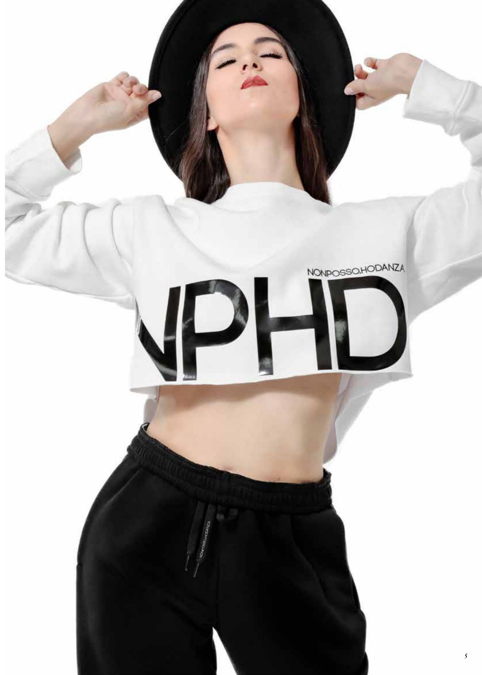
FELPA - maxi crop white art. 0043 size: AS - One Size