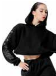
FELPA - swipe up - art. 0026 #Pagina: 12, 13, 14, 15

Panta tuta in morbido filato misto lana merinos. Confortevole sulla pelle perché non da prurito. Caldo ma leggero. Vestibilità comoda, maglia rasata con alto bastonetto che avvolge la caviglia fino al polpaccio, per un maggiore slancio della gamba e una migliore evidenza del movimento di gamba-piede. Glamour street pulito, ma deciso ed unisex. Coulisse in vita. Colore nero Stampa per la trasparenza naturale del colore, lungo la gamba. Composizione: 50% Acrilico, 20% Viscosa, 20% Cotone, 10% Lana. Taglie: XS, S, M, L. Made in Italy.