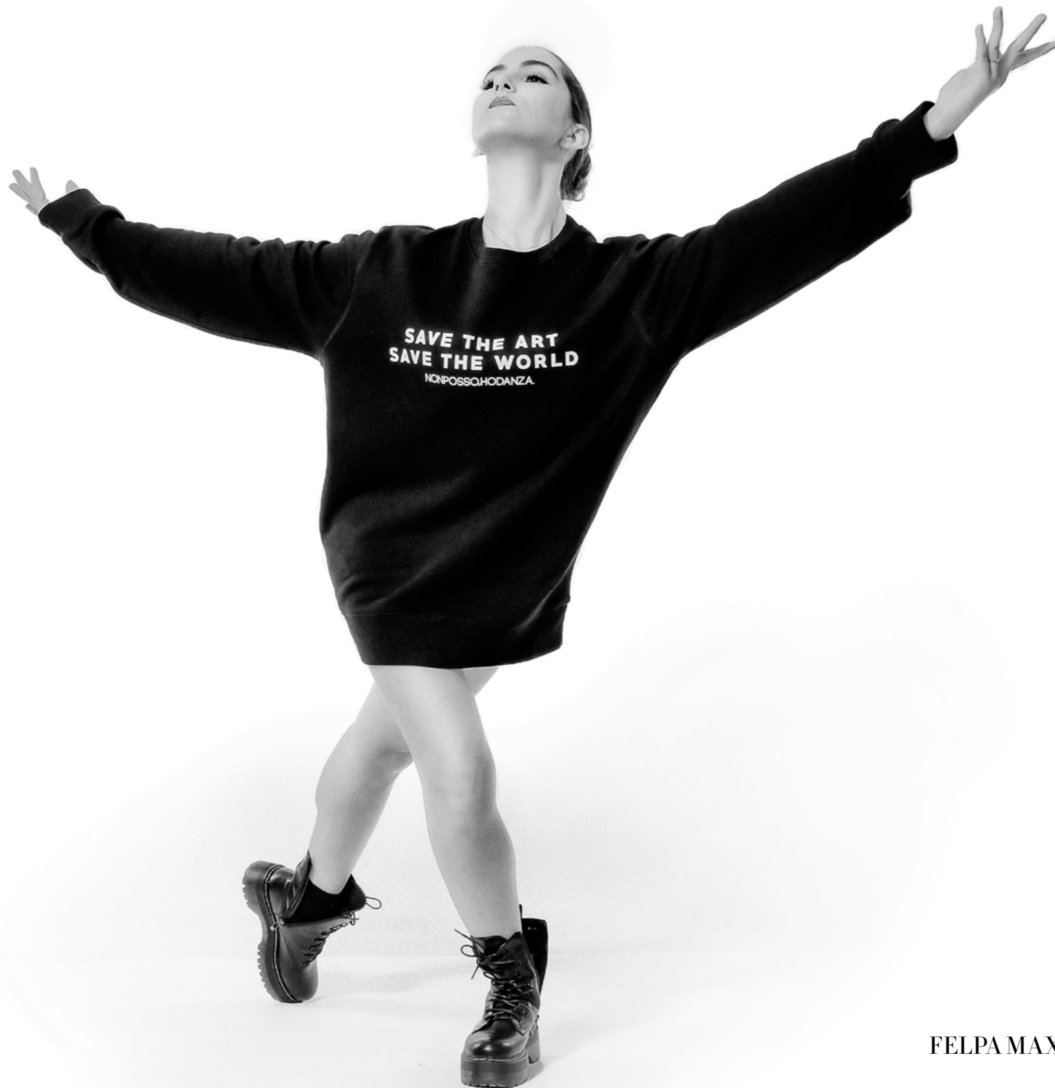
FELPA MAXI - save the art save the world art. 0042-A size: AS - One Size