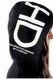
JACKET - jacket maxi cappuccio - art. 0024 #Pagina: 18, 19, 20, 21

Il tessuto di alta qualità, con mano-felpe ancora più calda e soffice, ottimizzano il confort e la resistenza all'uso del capo. Baggy pants ispirato al modello della scuola Alvin Ailey. Vestibilità ampia e comoda. Adatto perciò, sia per il riscaldamento in sala, sia nell'attività sportiva e nello street wear quotidiano. Unisex. Con coulisse ed elastico in vita, elastico alla caviglia, due tasche interne laterali. Colore nero. Logo hashtag a banda, in bianco lucido. Coordinato alla felpe Swipe Up. Composizione: 80% Cotone, 20% Poliestere. Taglie: XS, S, M, L. Made in Italy.