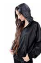
JACKET - zip triacetato - art. 0020 #Pagina: 29, 30, 31

Felpe in materiale ecosostenibile. Vestibilità oversize. Indosso pratico e funzionale ad ogni tipologia di fisicità. Rifinita con costina al fondo, nel collo e nelle maniche. Maniche set-in con attaccatura bassa, ampie ed abbondanti. Cuciture laterali per la tenuta della caduta. Nastro interno parasudore. Mezzaluna in jersey sul collo di decoro al retro. Grande stampa slogan per una collezione che più che mai, dato il momento, mixa il bello al significativo, la moda, al sociale. In lucido transfer bianco laminato. Nuova linea di tendenza in perfetto stile StreetChic. Taglie: XS, Taglia unica. La taglia unica veste dalla S alla M. La taglia XS veste 12 anni. Composizione: 80% Cotone pettinato, 20% Poliestere.