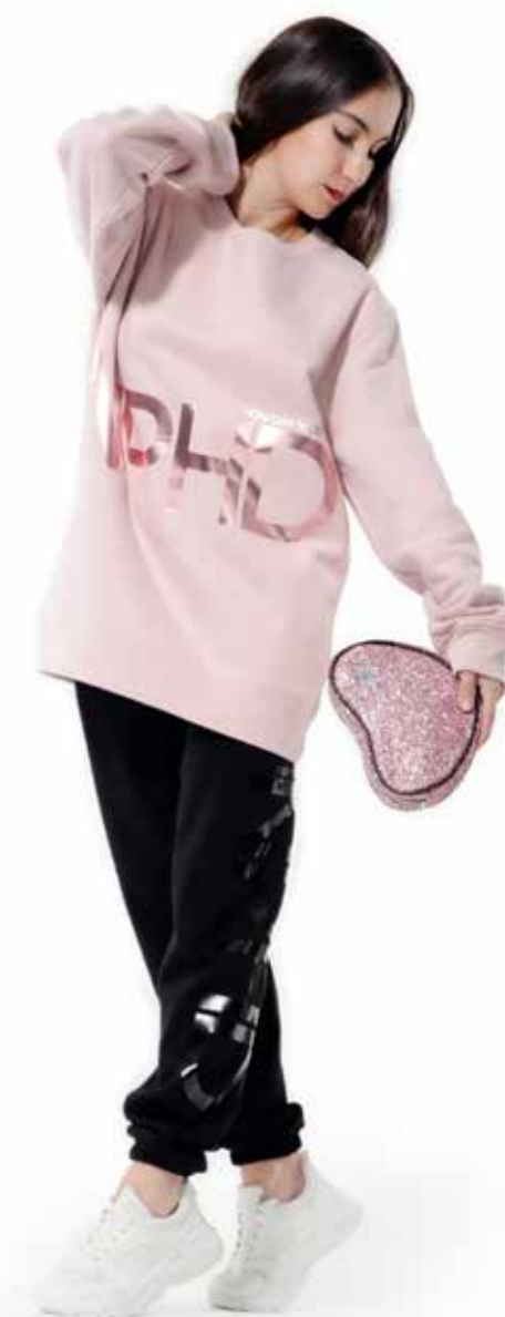
FELPA MAXI - rose dance art. 0041 size: AS - One Size