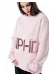
FELPA MAXI - rose dance - art. 0041 #Pagina: 22, 23, 24, 25

Ampia felpe con zip. Vestibilità oversize unisex. Indosso pratico e funzionale ad ogni tipologia di fisicità. Rifinita con costina nelle maniche e nel fondo. Ampia tasca a marsupio sul davanti. Caratterizzata dal maxi cappuccio con stampa transfer logo over colore bianco, a contrasto, con coulisse regolabile. Mix di stile street e rigore del bianco e nero. Per una contaminazione di tendenze e culture di danza. Coordinato con il panta Alvin New Logo. Abbinabile anche al panda accademico lana logo Athleisure e panta accademico lana New Logo piccolo della nuova collezione. Composizione: 80% Cotone, 20% Poliestere. Taglie: XS, S, M, L. Made in Italy