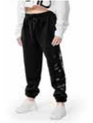
PANTA - alvin new logo - art. 0025-B #Pagina: 6, 7, 21

Felpa garzata in materiale ecosostenibile. Il poliestere è ricavato da 6 bottiglie di plastica riciclata. Morbidissima al tatto. Vestibilità oversize. Indosso pratico e funzionale ad ogni tipologia di fisicità. Rifinita con costina nel collo e nelle maniche. Maniche set-in con attaccatura bassa, ampie ed abbondanti. Cuciture laterali per la tenuta della caduta. Nastro interno parasudore. Mezzaluna in jersey sul collo di decoro al retro. Fondo tagliato al vivo, con grande stampa logo NPHD. Transfer nero vernice lucido. Nuova linea di tendenza in perfetto stile StreetChic. Composizione: 80% Cotone pettinato, 20% Poliestere. Taglie: XS, Taglia unica. La taglia unica veste dalla S alla M. La taglia XS veste 12 anni.