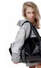
FELPA - zip hoodie girl - art. 0040 #Pagina: 50, 51, 52, 53

Soffice sweatshirt in colore rosa confetto con stampa "Grande Pot-Pourri" in seta, sul davanti, effetto reality. Vestibilità sciolta. Girocollo, polsini e fondo con costina. Giromanica morbido con doppia impuntura. Lunetta parakudore Coordinata al Pantaloni Alvin borchiette Taglia: XXXS 7/8, XXS 9/11 Composizione: 60% Poliestere 40% Cotone