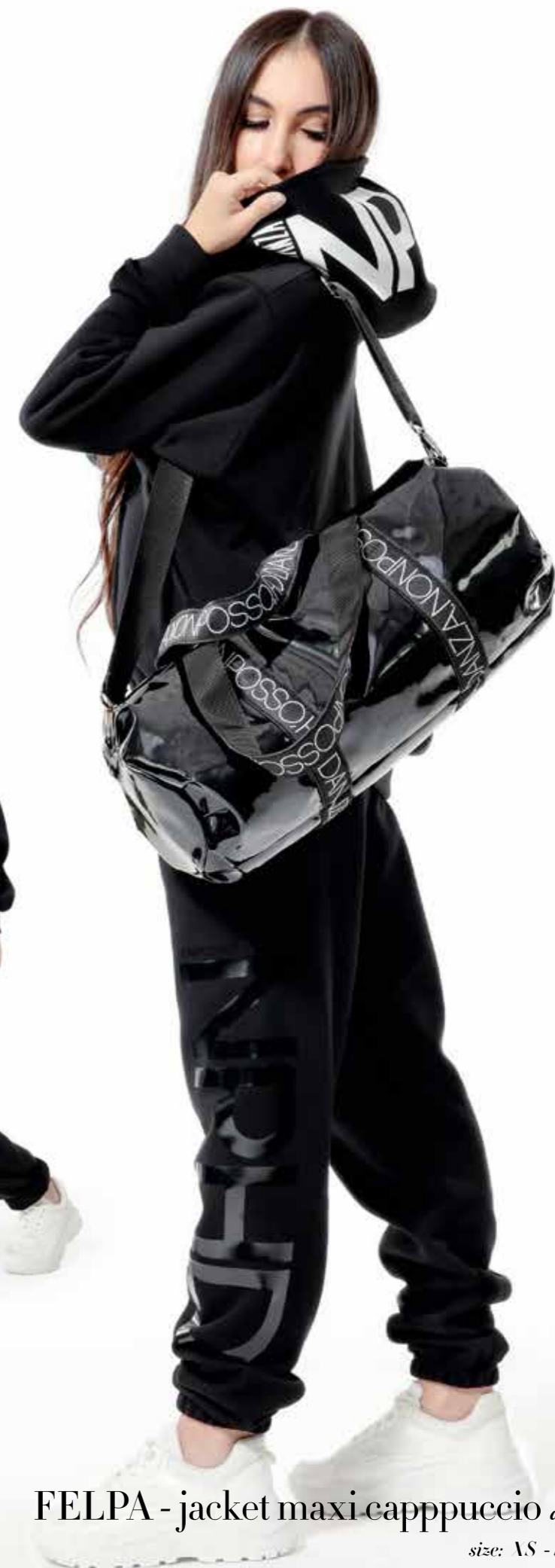
FELPA - jacket maxi cappuccio art. 0024 size: S - M - L