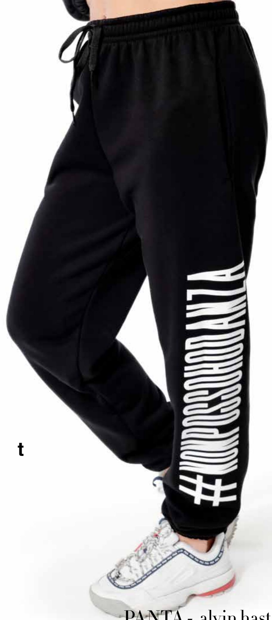
PANTA - alvin hastag art. 0025 size: AS - S - M - L