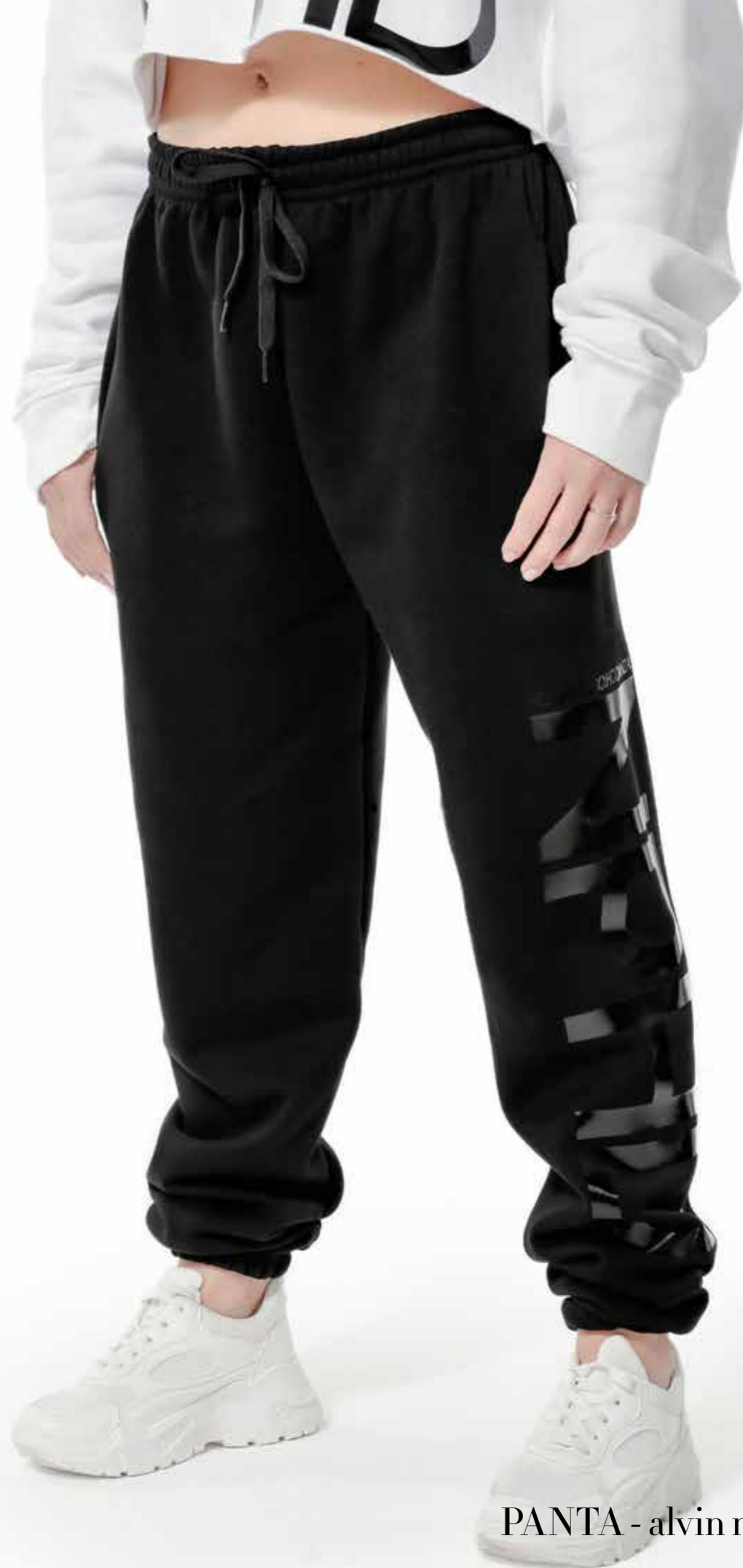
PANTA - alvin new logo art. 0025-B size: AS - S - M - L