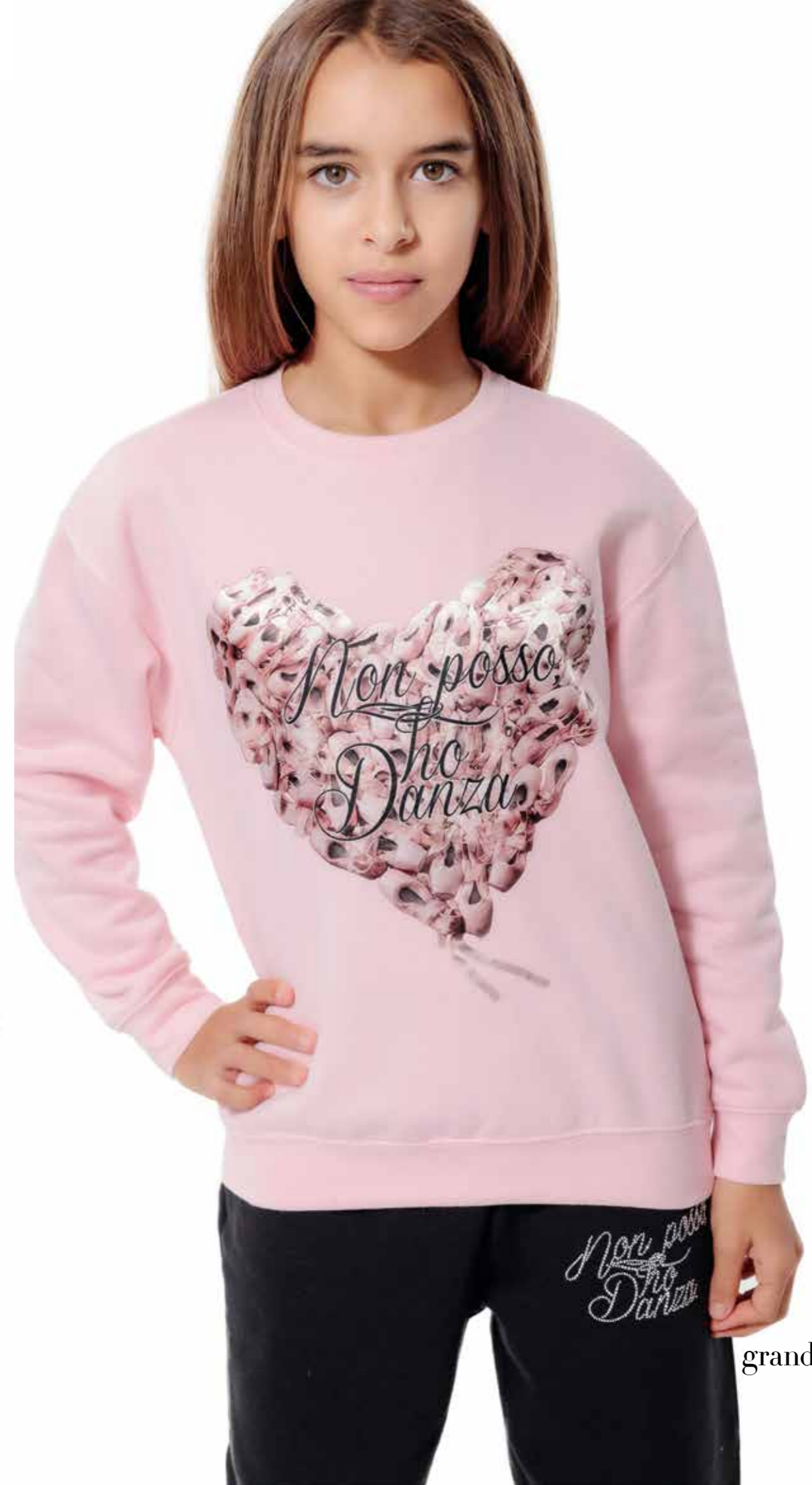
FELPA grande cuore art. 0039-A size: AAAS (7-8 anni) AAS (9-11 anni)