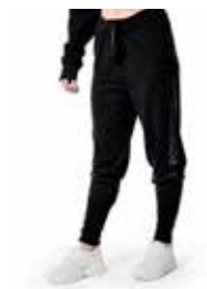
PANTA - accademico lana logo accademico - art. 0036-A #Pagina: 9, 11

Panta tuta in morbido filato misto lana merinos. Confortevole sulla pelle perché non da prurito. Caldo ma leggero. Vestibilità comoda, maglia rasata con alto bastonetto che avvolge la caviglia fino al polpaccio, per un maggiore slancio della gamba e una migliore evidenza del movimento di gamba-piede. Glamour street pulito, ma deciso ed unisex. Coulisse in vita. Colore nero Stampa dettaglio transfer nero lucido New Logo NPHD. Composizione: 50% Acrilico, 20% Viscosa, 20% Cotone, 10% Lana. Taglie: XS, S, M, L. Made in Italy.