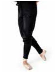
PANTA - accademico lana new logo - art. 0036-B #Pagina: 10, 15, 25

Alla qualità uniamo la bio sostenibilità. Felpe in materiale ecosostenibile. Il poliestere è ricavato da 6 bottiglie di plastica riciclata. Morbidissima al tatto. Vestibilità oversize. Indosso pratico e funzionale ad ogni tipologia di fisicità. Rifinita con costina al fondo, nel collo e nelle maniche. Maniche set-in con attaccatura bassa, ampie ed abbondanti. Cuciture laterali per la tenuta della caduta. Nastro interno parasudore. Mezzaluna in jersey sul collo di decoro al retro. Grande stampa design new logo NPHD, in lucido transfer bianco laminato. Composizione: 80% Cotone pettinato, 20% Poliestere. Taglie: XS, Taglia unica. La taglia unica veste dalla S alla M. La taglia XS veste 12 anni.