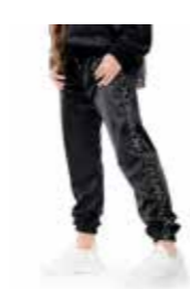
PANTA - triacetato - art. 0021 #Pagina: 4, 30, 31, 33

Giacca zip modello d'ispirazione bomber, unisex. Vestibilità over creata dall'attaccatura bassa e larga della manica. Realizzato in tessuto triacetato felpato internamente. Caldo, impermeabile, inguallabile e resistente all'uso. Perfetto per il tragitto casa/scuola di danza/palestra, unisce, allo stile modern street, la praticità di poter vestire "a cipolla", per essere già pronti per la lezione. Colore nero leggermente lucido. Costina al fondo e nelle maniche. Tascone a marsupio. Grande cappuccio bordato con nastro di tessuto nero, stampa logo bianco. Pensato e creato come tuta con il pantalone in triacetato, viene proposto al pubblico anche come capo singolo. Composizione: 100% poliestere. Taglia: XS, S, M, L. Made in Italy