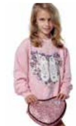
FELPA - pot pourri - art. 0039-B #Pagina: 45, 46, 47, 48

Baggy pants ispirato al modello della scuola Alvin Ailey. Must Have, a grande richiesta ora anche per i più piccoli. Vestibilità ampia e comoda, si adatta ad essere indossato sia per il riscaldamento in sala, sia nell'attività sportiva e nello street wear quotidiano. Modello tubolare, senza cucitura laterale esterna. Con coulisse ed elastico interno in vita, alla caviglia, due tasche interne laterali. Logo ad intreccio in luminose borchiette. L'alta qualità della felpa rende questo capo particolarmente resistente all'uso nelle sue caratteristiche di forma, consistenza, colore e sgualcibilità. Coordinato alla Felpa Bimba Grande Cuore e Felpa Bimba Pot-pourri Composizione: 50% cotone, 50% poliestere, felpato internamente. Taglia: 7/8, 9/11