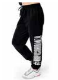
PANTA - alvin hastag - art. 0025 #Pagina: 12, 13, 14, 17

Trasformista. Adattabile, nella forma e lunghezza, per un'immagine sempre nuova e creativa. Grazie ad uno strategico tirante sul fondo, la linea da ampia, diventa arricciata sui fianchi, oppure "a palloncino" crop. Maniche ampie con elastico al fondo. Attaccatura spalla bassa. Ampio cappuccio senza coulisse. Grande stampa transfer nero lucido sul braccio con logo bastone. Coordinata con il Panta Alvin Hashtag con logo a contrasto colore. Abbinabile anche al panda accademico lana logo Athleisure e panta accademico lana New Logo piccolo della nuova collezione. Composizione: 80% Cotone, 20% Poliestere. Taglie: XS e taglia unica. La taglia unica veste dalla S alla M. La taglia XS veste 12 anni. Made in Italy.