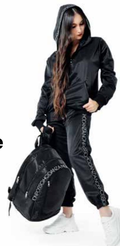
bag school big size art. BGS01

Modello che punta ad ottimizzare la capienza. Ergonomicità e stile grintoso, materiale indistruttibile d'uso sportivo e logo grograin danza. Polifunzionale, per il variegato e creativo mondo dei giovani. In nylon cordura rinforzato. Quattro scomparti; 2 grandi tasche laterali, una più piccola frontale, un capiente porta scarpe sul fondo. Manico per il sostegno a mano. Robuste ed imbottite bretelle sagomate per il fissaggio sulle spalle. Fettuccia logo applicata in decoro e griffe. Dimensioni: Altezza 45 cm, Larghezza 33 cm, Profondità 28 cm. Made in Italy.