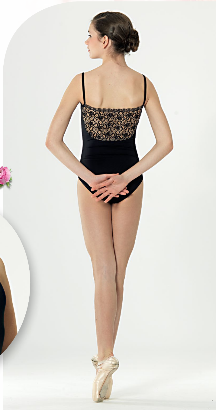
JS4074 LEXA Meryl Noir/Dentelle Chair Doublé devant