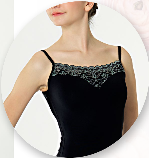
JS4074 LEXA Meryl Noir/Dentelle Tilleul Doublé devant Tailles : 10a au 46