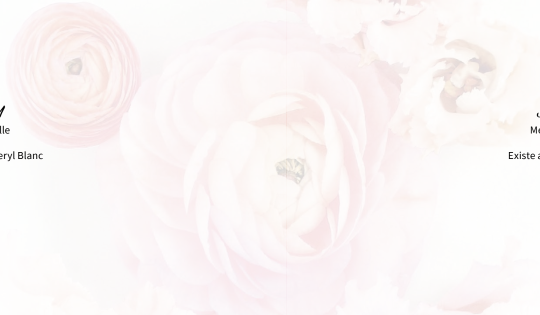
JS4036 NAHELI Meryl Cyprés/Broderie Doublé devant Existe aussi en Meryl Cerise Tailles : 10a au 42